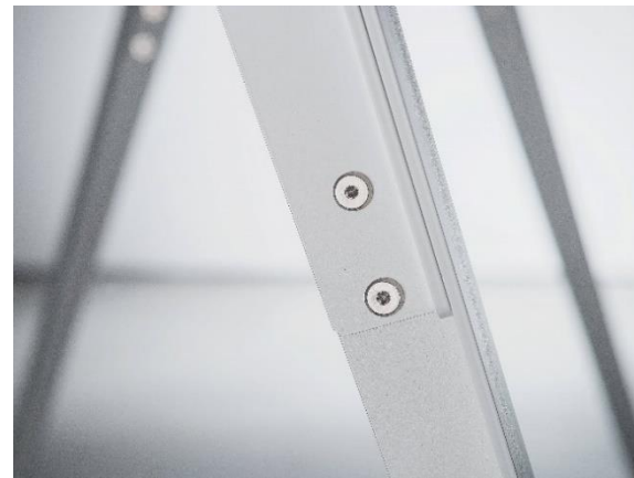
Tischhöhe verstellbar 740 – 790 mm