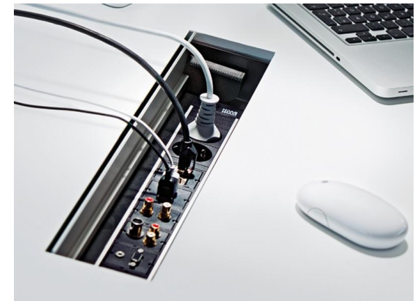
Mediaboxen nach Kundenwunsch