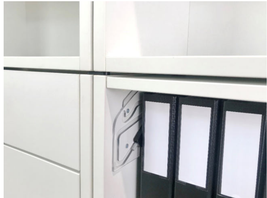
Klappe vollumfänglich einschiebbar