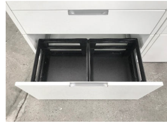
Schublade A4 mit 2 HR-Einsätzen