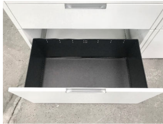
Schublade A4 mit Rahmen