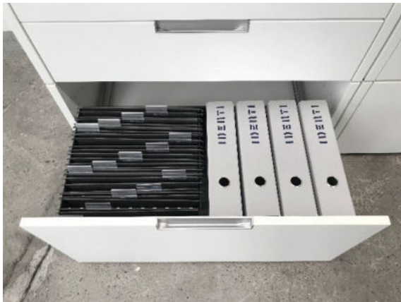
Schublade A4 mit Rahmen und Trennsteg