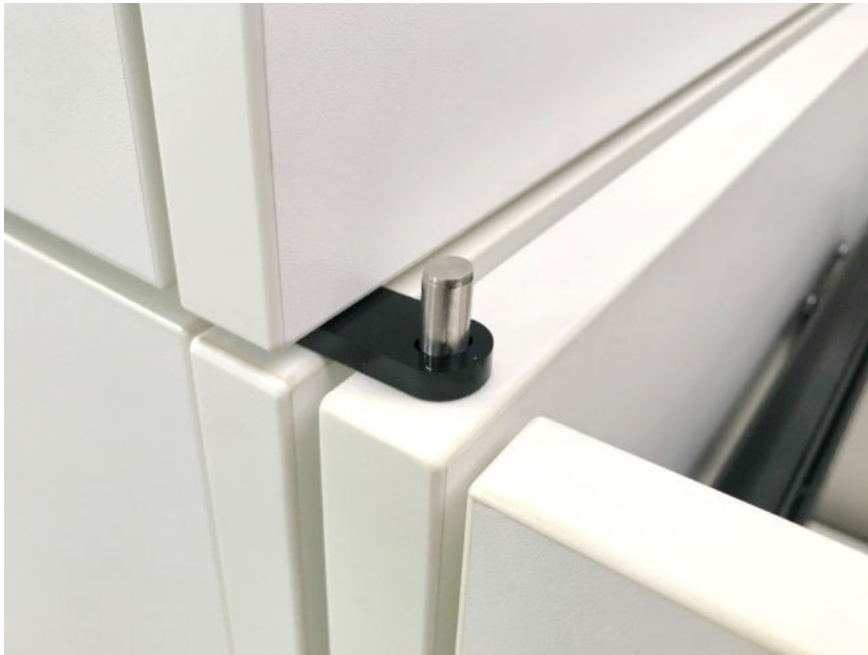
clevere Steckverbindung für werkzeuglose Montage/Demontage