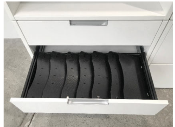
Schublade A6 mit Schrägfachablage