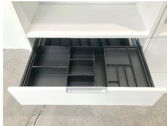
Schublade A6 mit Einteilungsset Nr. 2